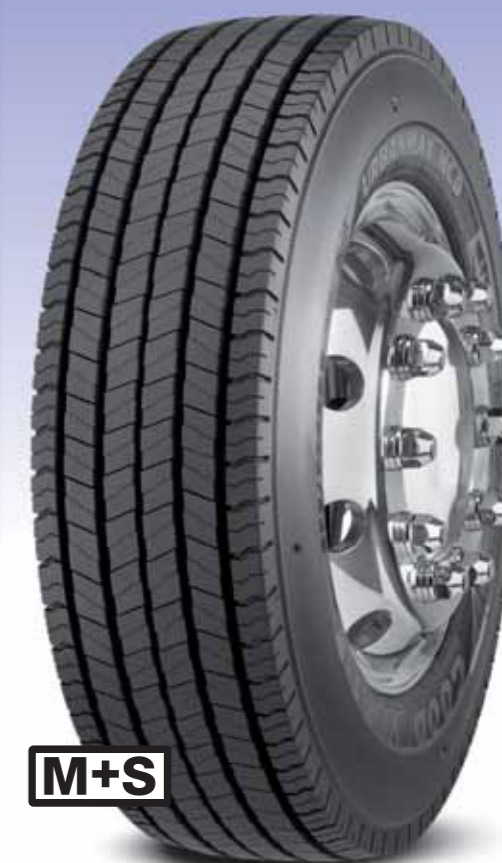
UrbanMax MCD Traction